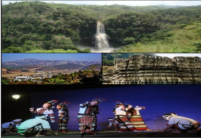
Clockwise from top: Vantawng Waterfall, Castle of Beino/Boinu, Mizo men and women performing Cheraw dance, Champhai