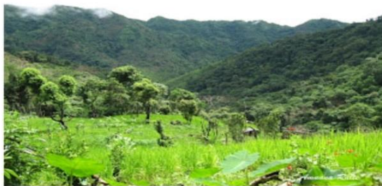
Agriculture(Jhum) site in Sialsuk Village, Mizoram, Pic taken by Amuana Ralte

If you learn or read carefully 1-10 in Mizo tawng you can easily master beyond 10 also as it repeat in each count to decade numbers too.